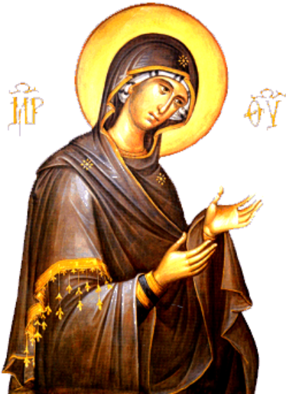
Η Παναγία στη Μεγάλη Δέηση