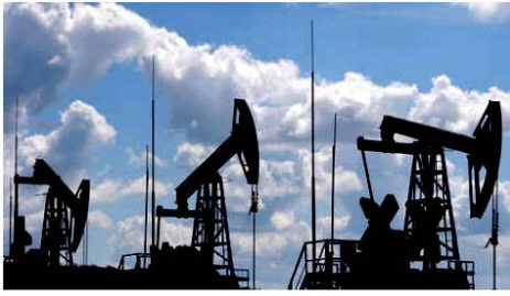
Oil CRASHES 30% over Saudi Arabia-Russia crude price war & coronavirus fears