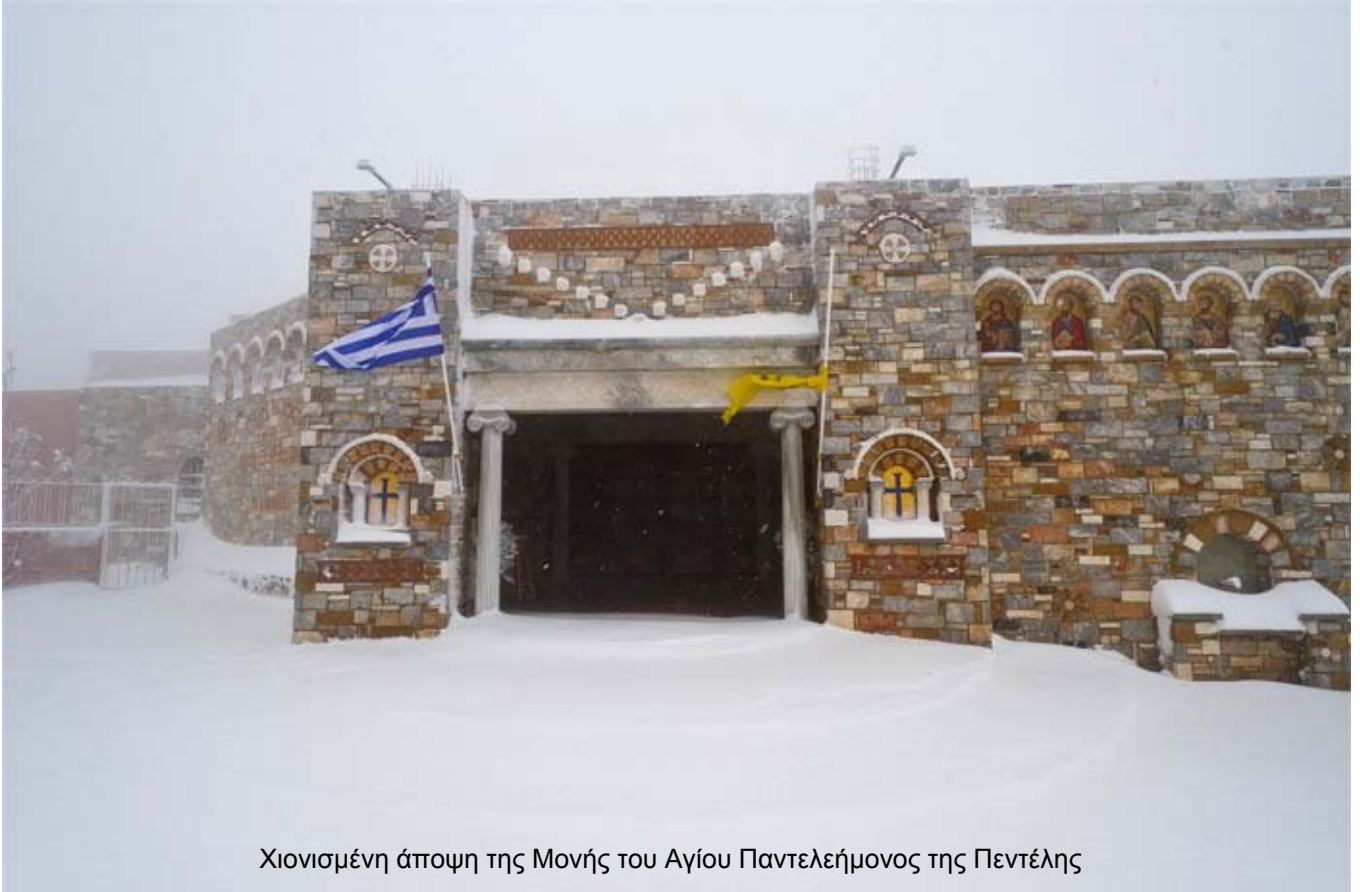
Χιονισμένη άποψη της Μονής του Αγίου Παντελεήμονος της Πεντέλης

Ο Γέροντας, συνεχίζει ο π. Ζωσιμάς, με διόρθωνε σε όλα, ακόμη και στις φορεσιές, στα ράσα. Μου έλεγε: « Παιδί μου, πρέπει να είσαι καθαρός , να πλένεσαι τακτικά, να κόβεις τα νύχια σου μέχρι το κρέας. Το Μοναστήρι μας εδώ είναι προσκύνημα, είμαστε κοντά στην πόλη και έρχονται εδώ άνθρωποι όλων των τάξεων . Γι' αυτό χρειάζεται να έχουμε καινούργια ράσα για τις Κυριακές, μία ξεχωριστή φορεσιά για τις μεγάλες γιορτές, και άλλα για τις καθημερινές». (B-142/143/144)