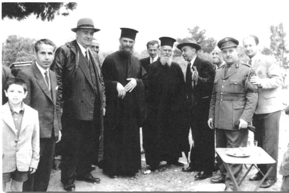
Με τον γέροντα Πορφύριο τον Καυσοκαλυβίτη.