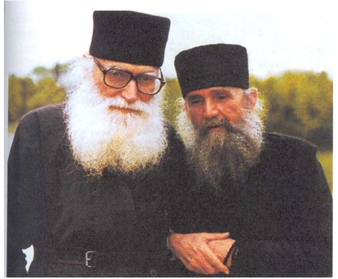
οι γέροντες Εφραίμ ο Κατουνακιώτης αριστερά, και Εφραίμ ο Φιλοθεΐτης δεξιά, πνευματικά τέκνα του γ. Ιωσήφ του Σπηλαιώτου

Λέγει ομοίως και ο Άγιος Εφραίμ ο Σύρος: