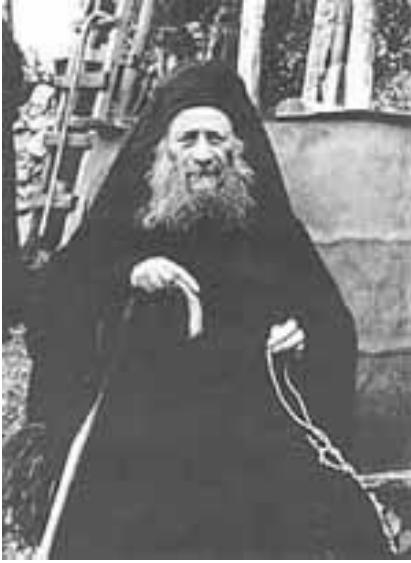
γ. Ιωσήφ ο Σπηλαιώτης

Όταν ο κόσμος διαστραφεί τόσο, που τα νέα παιδιά που θα γεννιούνται δεν θα μπορούν να γνωρίσουν τον (αληθινό) Θεό, τότε θα έρθει το τέλος.