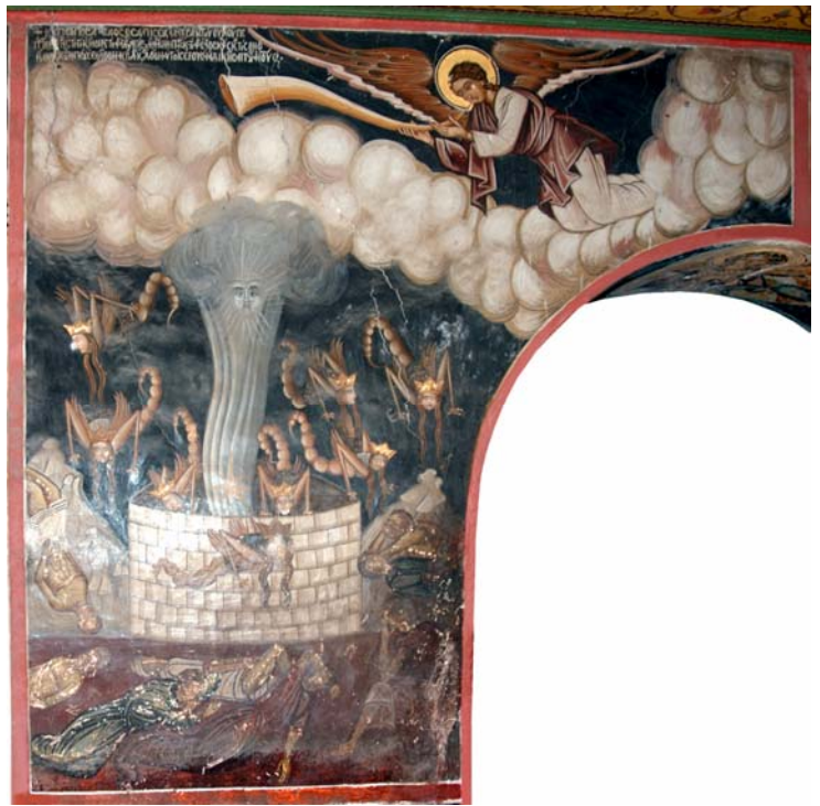
Αρχιμ. ΧΑΡΑΛ. ΒΑΣΙΛΟΠΟΥΛΟΥ: Η ΑΠΟΚΑΛΥΨΙΣ ΕΞΗΓΗΜΕΝΗ