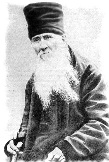
ο άγιος στάρετς Αμβρόσιος της Όπτινα

«Αυτός που είδε αυτό το όραμα σωστά παρατήρησε ότι η εξήγηση που του δόθηκε από μια εσωτερική φωνή ήταν φοβερή. Φοβερός θα είναι ο Δεύτερος Ερχομός του Χριστού, και φοβερή η τελευταία Κρίση του κόσμου».