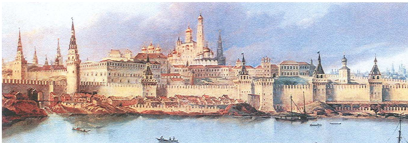
Η Μόσχα κτισμένη με ισχυρά τείχη, κατά παρόμοιο τρόπο προς την Βυζαντινή πρωτεύουσα

«Οι βασιλείς των εθνών κυριεύουσιν αυτών, και οι εξουσιάζοντες αυτών ευεργέται καλούνται. Υμείς δε ουχ ούτως, αλλ' ο μείζων εν υμίν γινέσθω ως ο νεώτερος, και ο ηγούμενος ως ο διακονών». (Λουκ. Κβ 25-26).