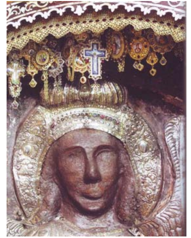
Ἄνω ο Ἀρχάγγελος του Μανταμάδο, καὶ κάτω ο τρόπος που αἰγιογραφήθηκε ἀπὸ χῶμα καὶ αἷμα μοναχῶν.

τὸ ὄχημα εὐρίσκετο ἐν κινήσει. Ἐκαστος ἐκ τῶν τεσσάρων τροχῶν ἔφερε ἐν ἑαυτῷ δεύτερον τροχόν, ὥστε νὰ σχηματίζεται ὀρθὴ γωνία ἐν τῷ κέντρῳ καὶ δύναται νὰ κινήται τὸ τροχοφόρον ἄρμα πρὸς ὅλας τὰς διευθύνσεις χωρὶς νὰ στρέφονται οἱ τροχοί. Ἐπὶ τῶν Χερουβίμ ὑπῆρχε στερέωμα τοῦ Οὐρανοῦ ὁμοιον πρὸς κρύσταλλον καὶ ἐπὶ τοῦ στερεώματος τούτου μορφή ἀνθρώπου καθήμενου ἐπὶ θρόνου, ὁ ὁποῖος ἐφεγγόβηλει μετὰ λάμπιν οὐρανοῦ τόξου. Ἴδὲ σχῆμα. Τοῦτο ἦτο ὄραμα