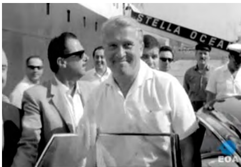
Θέση στο site:

Αποθηκευμένο (αγγλικά) εδώ: www.imdleio.gr/diaf/2010/10/Werner_Von_Braun_Predictions.pdf