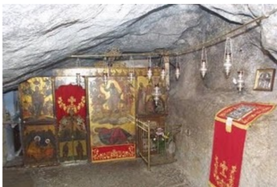
Το ιερό Σπήλαιο της Αποκαλύψεως στην Πάτμο.