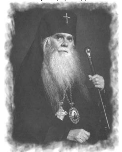
άνω ο αρχιεπίσκοπος Αβέρκιος Τσοσέβ , αξιόλογος ερμηνευτής της Αποκάλυψης

Αυτά ας τα κατανοήσουν όσοι έχουν την πνευματική ικανότητα, διότι απευθύνονται στους πιστούς κάθε Εκκλησίας, σε κάθε χρόνο και τόπο: «Όποιος έχει αυτή ας ακούσει τι λέγει το Πνεύμα στις εκκλησίες» .