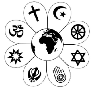
άνω: άλλο Πανθρησκευτικό Σύμβολο