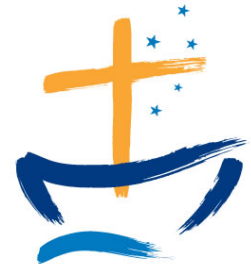
National Council of Churches in Australia Εθνικό Συμβούλιο Εκκλησιών Αυστραλίας