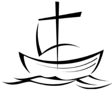
Christ Lutheran Church Χριστιανική Λουθηρανική Εκκλησία