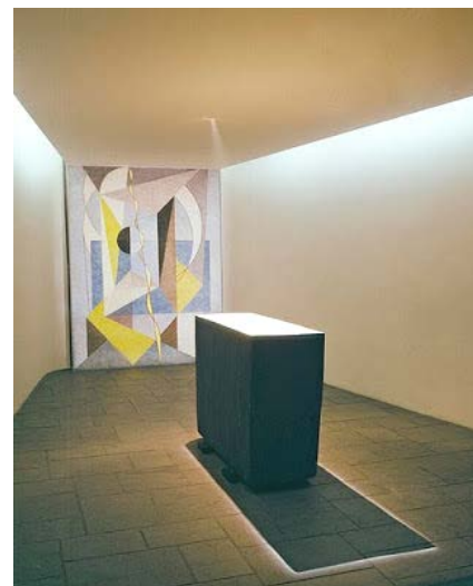
Το δωμάτιο διαλογισμού στον ΟΗΕ

Περιέργως οι ανόητες φαντασιώσεις των αστρομάντιδων γυναικών προτιμήθηκαν από το αληθινά ειρηνικό κάλεσμα του Χριστού και έγιναν δόγμα στην Νέα Τάξη. Συνεργεί σ' αυτό η Μασονία, που είναι ένας ισχυρός αποκρυφιστικός μοχλός για την προώθηση των σχεδίων της παγκοσμιοποίησης. Ενώ ο ΟΗΕ στεγάζεται σε χώρα υποτίθεται Χριστιανική (τις ΗΠΑ), αντί να φτιαχτεί σ' αυτόν, τιμής ένεκεν, ένα εκκλησάκι προσευχής, φτιάχτηκε ένα δωμάτιο διαλογισμού σαν πυραμίδα χωρίς παράθυρα, που βρίσκεται ξαπλωμένη στο πλάι, με μια κουρελογραφία προς την κορυφή της. Στο κέντρο η αίθουσα έχει, ως βωμό, μια πέτρα από σκούρο γκρι μαγνητίτη 6 τόνων. Το δωμάτιο είναι χαμηλού φωτισμού, με μια επί πλέον μικρή δέσμη φωτός από το ταβάνι προς τον "βωμό".